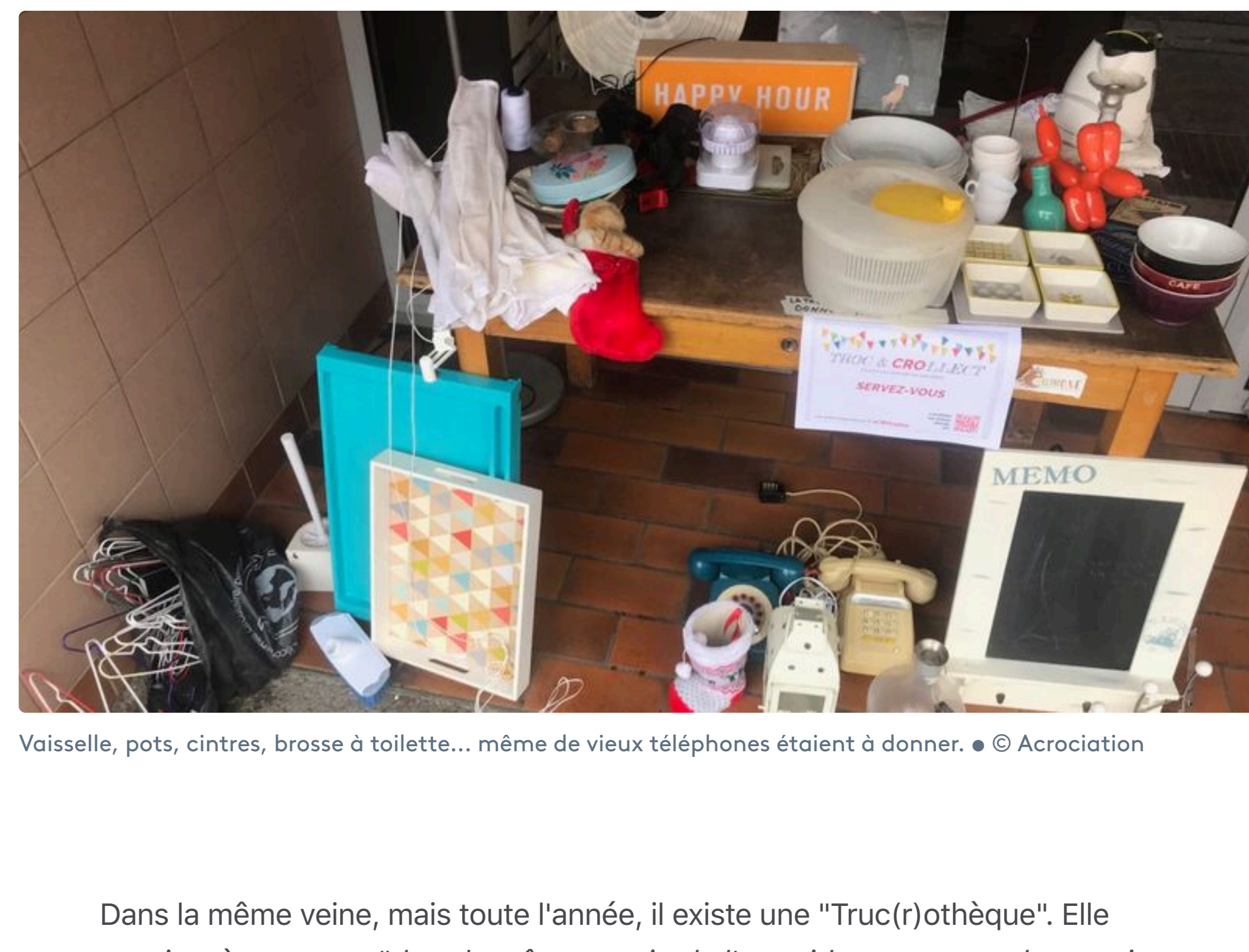
Vaisselle, pots, cintres, brosse à toilette... même de vieux téléphones étaient à donner.

La population de Cronenberg n'est pas en sucre. Et elle l'a prouvé en sortant quand même. "Ça marche en particulier avec les gens qui ont des petits enfants. Parce que ça tourne bien : jouets, doudous, vélos et casques... Et ça fait une sortie aux enfants le samedi matin. C'est très positif à nos yeux." Mais pour les plus grands, on pouvait aussi trouver "de la vaisselle, du matériel de jardinage... Les gens ont compris le principe de permettre à d'autres d'utiliser" tout ça, plutôt que de s'en débarrasser. Même de vieux téléphones en bakélite.