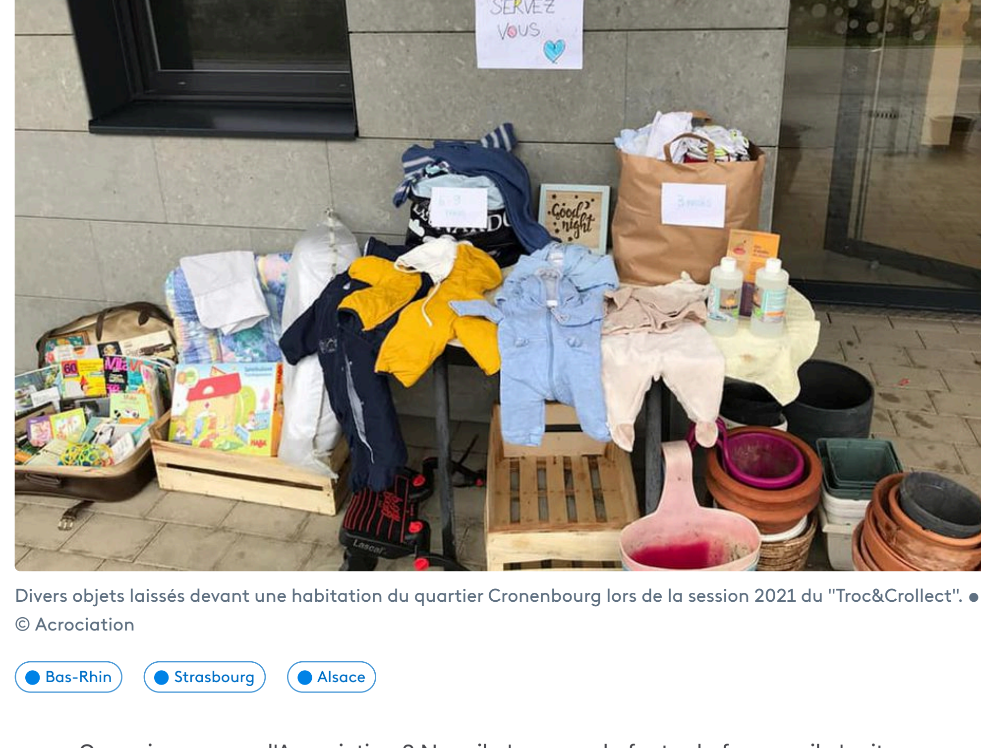
Divers objets laissés devant une habitation du quartier Cronenberg lors de la session 2021 du "Troc&Crollect".